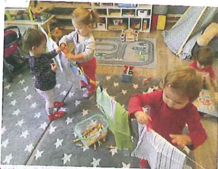
Mikrojesle Vsesličky ve Věstarech jsou zařízení tak, aby připomínaly spíše dětský pokoj než institucionální zařízení. Proto se tam děti cítí jako na návštěvě u kamaráda

Rodičům vyhovuje hlavně individuální přístup k dětem a malý kolektiv. Například děti s obtížnější adaptací si v mikrojeslích zvykají mnohem snadněji než ve velké skupině vrstevníků. Z malého kolektivu profitují i děti se sníženou imunitou, pro děti mladší jednoho roku jsou mikrojesle kromě soukromé rodinné chůvy jedinou možnou alternativou. Takto malé děti sa-